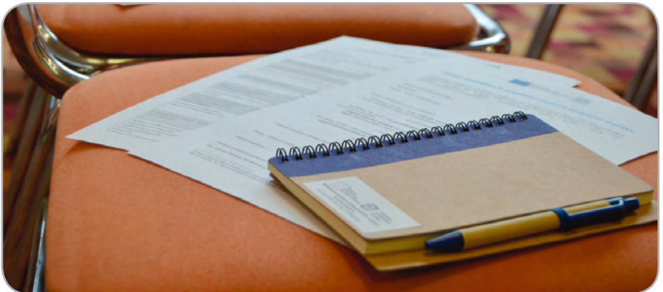
fotografie z konference