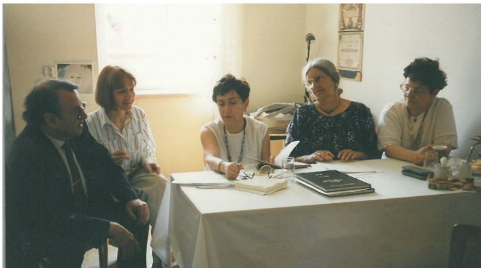
OBŘÁZEK 2: První státnice