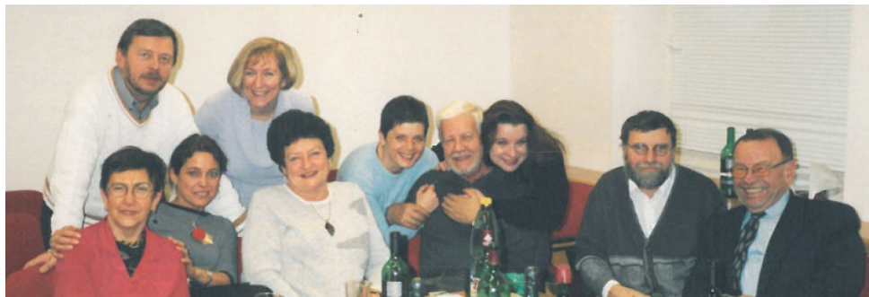
OBRÁZEK 4: Vánoční setkání na katedře sociální práce